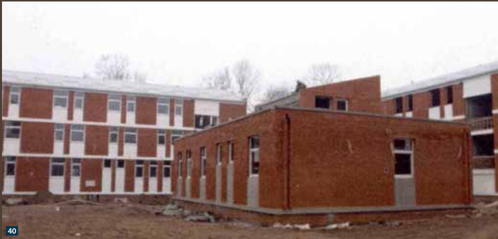
← Сlike 39 – Изградња новог оградног зида са караулама у Казнено поправном заводу у Нишу Fig. 39 – Construction of the new fence wall with watchposts in the Penal-correctional facility in Niš