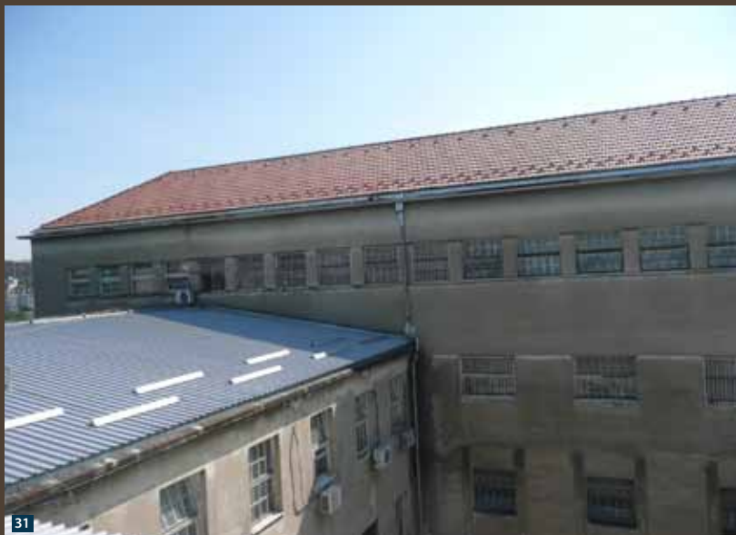
← Слика 29 и 30 санација и адаптација објекта број 3 у Казнено поправном заводу у Падинској Скели Fig. 29 and 30 Rehabilitation and refurbishment of the Facility no. 3 in the Penal-Correctional Facility in Padinska Skela