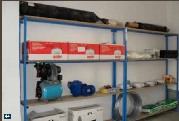
← Слика 41—44 – VET програм Fig. 41—44 – VET Program